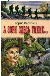
Борис Васильев «А зори здесь тихие»

Центральная тема романа Бориса Васильева «А зори здесь тихие» – жизнь, борьба и гибель от рук фашистской разведки пяти девушек-зенитчиц, которые по собственной воле пришли на фронт, почти не умея стрелять, и совершили в итоге подвиг. Писатель показывает, что на войне солдат забывает о возрасте, поле, статусе – всё это