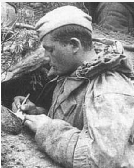
солдат Великой отечественной войны

Когда ребенок не знает, что такое бомбоубежище – хорошо это или плохо? Те, кто прошел войну, имеют вполне однозначный ответ на этот вопрос. «Новости литературы» представляют подборку лучших книг, посвященных Дню победы. Истории, рассказанные на их страницах – о непростом времени, определившем жизнь поколения, о любви к Родине и о чувстве долга, о настоящей дружбе и самопожертвовании, о том, какова была цена этой великой Победы.