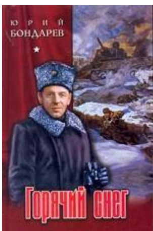
Юрий Бондарев «Горячий снег»